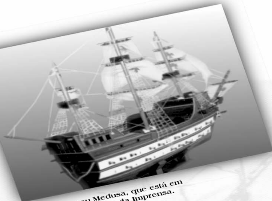
Réplica da nau Medusa, que está em exposição no Museu da Imprensa.

...os primeiros prelos da Imprensa Régia vieram nos porões da nau Medusa, quando da transferência da Corte Portuguesa para o Brasil, trazendo à colônia inestimáveis benefícios, dentre os quais, a criação de uma Imprensa Oficial?