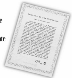
Replica do Decreto de 13 de maio de 1808.

...a Imprensa Nacional foi criada através do Decreto de 13 de maio de 1808, assinado pelo Príncipe Regente D. João, com o nome de Impressão Régia e seu objetivo era o de imprimir, com exclusividade, todos os atos normativos e administrativos oficiais do governo?