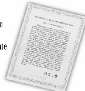
Replica do Decreto de 13 de maio de 1808.

...a Imprensa Nacional foi criada através do Decreto de 13 de maio de 1808, assinado pelo Príncipe Regente D. João, com o nome de Impressão Régia e seu objetivo era o de imprimir, com exclusividade, todos os atos normativos e administrativos oficiais do governo?